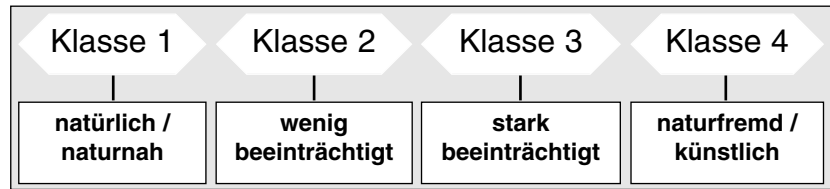
Tafel 4: Klassierung der Fliessgewässerabschnitte.

Schweiz) durchgeführt werden. Die kartographischen Darstellungen sollen, falls möglich, mittels Geographischer Informationssysteme erfolgen. Falls entsprechende Programme zur elektronischen Erfassung und Speicherung der Daten bereits entwickelt wurden, sind Angaben dazu in den separaten Teilpublikationen zu den verschiedenen Modulen enthalten.